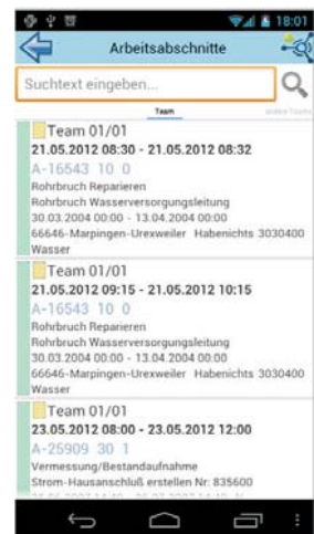
OPTIMUS Smart für unterwegs